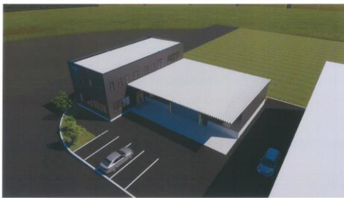
新事務所棟外観イメージ